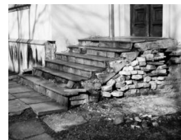
< Stan obecny

Stare schody od strony ulicy Na Nivách są w opłakanym stanie, niebezpieczne do użytku. W związku z tym przebiegnie w roku bieżącym, tj. 2012 budowa nowych, włącznie z bezbarierowym najazdem dla osób na wózkach inwalidzkich. Koszta przedsięwzięcia będą wynosić według oszacowania 300 tys. Kč. Materiał, z którego będą wykonane nowe schody, to granit.